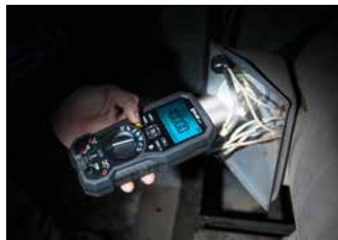
DM92和DM93的高亮度LED照明灯