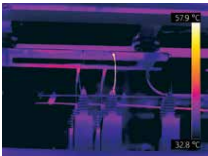
输电线路变压器温度过高