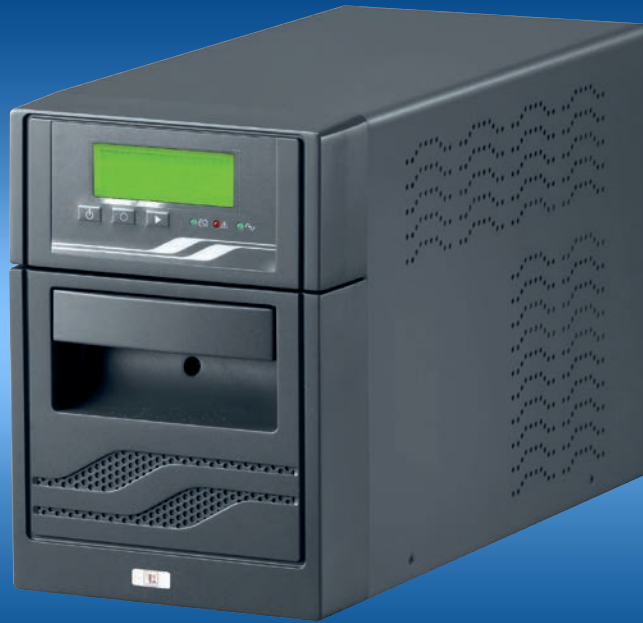
EA-UPS INFC 1000